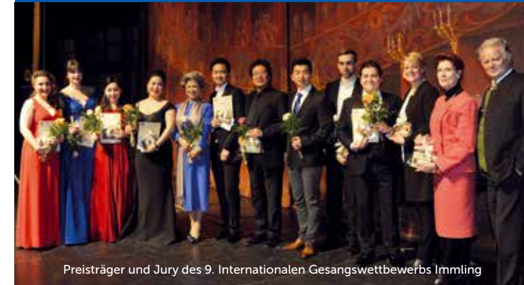
Preisträger und Jury des 9. Internationalen Gesangswettbewerbs Immling